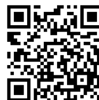
入学前アンケート 入力フォーム