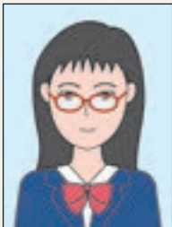
眼鏡のフレームが 目にかかっている