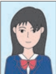
髪が目にかかっている