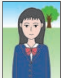
背景が写っている